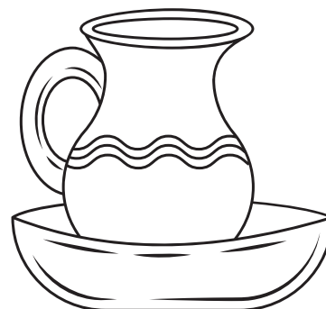
Bacia e jarra

RECIPIENTE EM QUE SE CONSAGRA O VINHO DURANTE A SANTA MISSA.